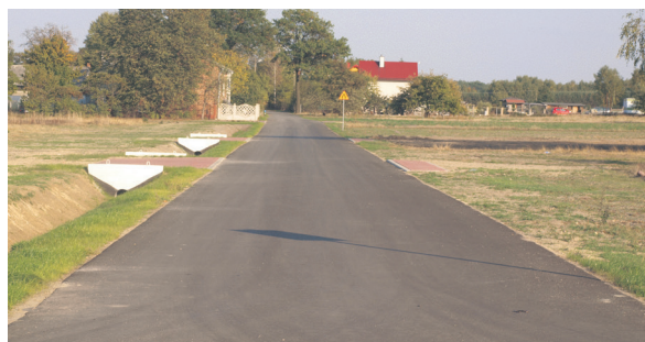
Rozbudowa drogi gminnej w miejscowości Eligiów

W przypadku tej inwestycji zakres wykonywanych prac był nieco bardziej rozległy, bowiem obejmował nie tylko działania związane z utwardzeniem i poszerzeniem drogi, ale również z odtworzeniem istniejących już zjazdów na działki przyległe do pasa drogowego, jak również czynności związane z pogłębieniem oraz oczyszczeniem przydrożnych rowów. Warto podkreślić, iż wykonano również utwardzenie pobo-