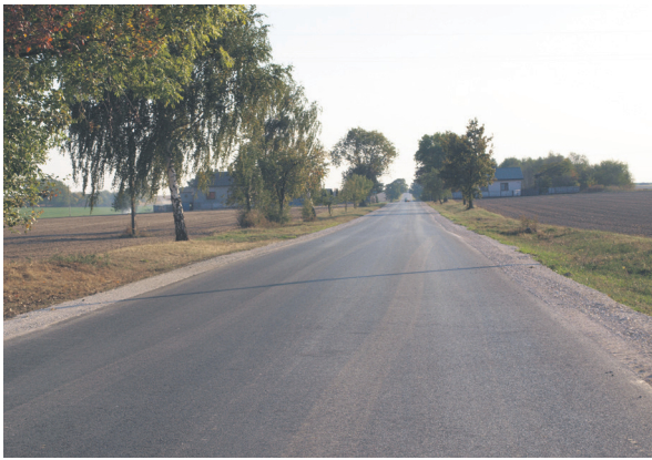
Przebudowa drogi dojazdowej do gruntów rolnych Chorzenicach