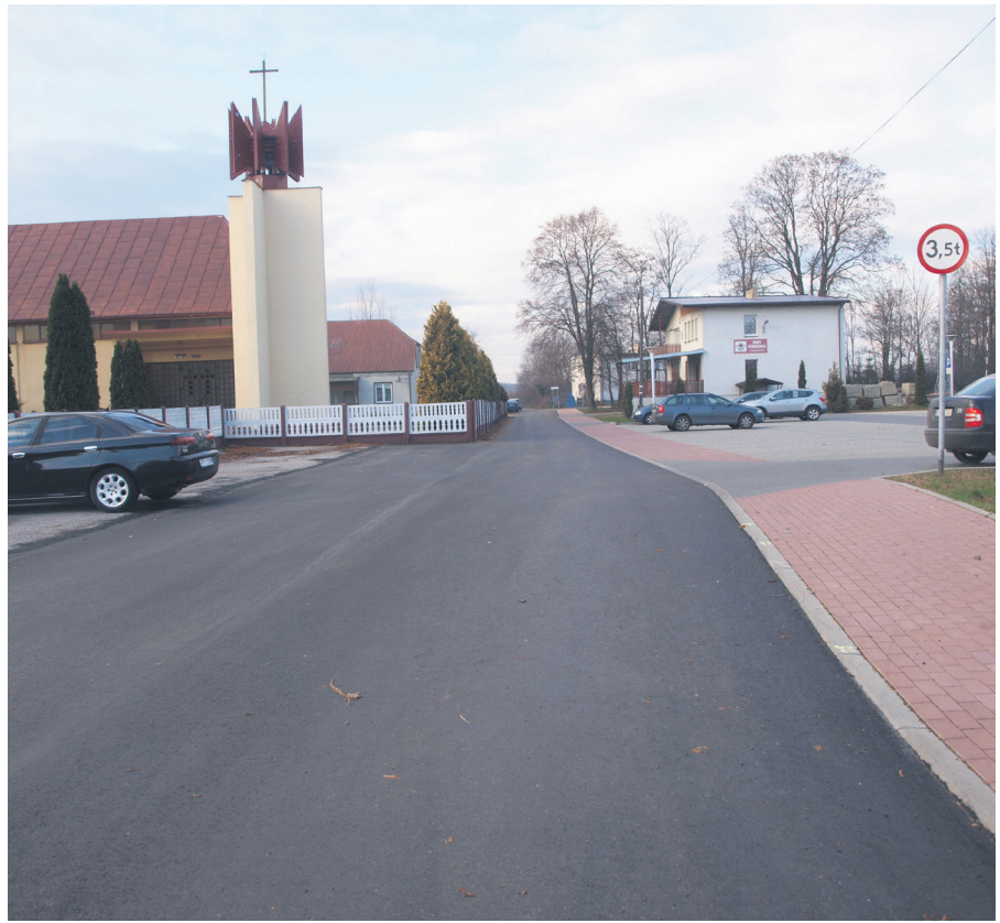
Rozbudowa drogi gminnej w miejscowości Dworszowice Pakoszowe